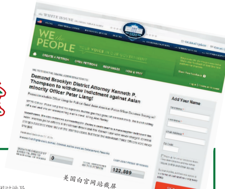
美国白宫网站截图

华权会注册签名后，就开始在微信社交媒体中推。结果在短短一星期内，签名就已经超过10万。所展示的华人之间的团结令人欣慰。“我认为此次10万