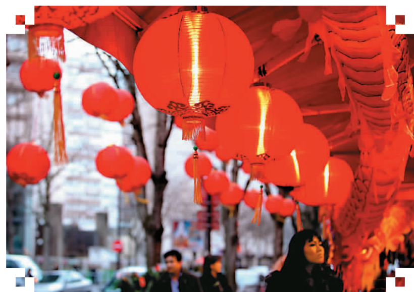
年味十足的海外唐人街

走过百年风雨的唐人街，见证了无数海外华侨华人的艰苦奋斗史，也承载了他们对故土的眷恋。近些年，面对唐人街的种种问题，华侨华人已经开始群策群力，积极地为保护唐人街奔走努力。