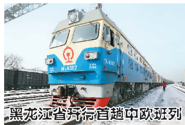
黑龙江省开行首趟中欧班列

赵乐际、赵洪祝出席开学典礼。中央有关部门负责同志，中央党校校委成员、新入学学员、在校全体学员和部分教职工参加开学典礼。中国浦东、井冈山、延安干部学院通过视频会议系统同步举行开学典礼。