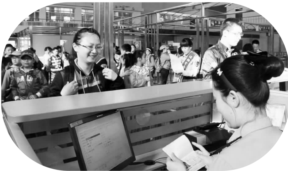
黑河边防检查站工作人员正在为未成年人办理出境手续。