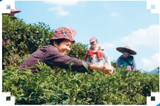
广西:昭平春茶新开采

在发达国家,带薪休假已成为国民休假方式的常态,政府与社会监督机制持续发挥作用。如在法国,劳动者带薪年假制度是由法国总工会和雇主协会协商而来的。法律规定带薪年假30天,但劳动者通过集体协商可获得5-6周的带薪假期。在我国,可将企业职工带薪年假协商权委托给各级工会。借鉴法国做法,工会、借鉴法国做法,工会组织全权代表职工与企业主进行谈判协商,为台湾同胞送去新春祝福,共同迎接元宵佳节。