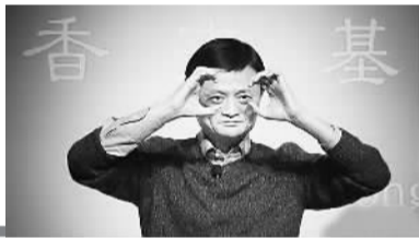
马云在香港演讲,鼓励青年创业。阿里集团还投资10亿港元成立了香港青年企业家基金。

这班年轻人的志向,正契合了香港青年的创业热潮。香港是一个充满生命力、青年积极自主人生的城市,何况还有勇于拼搏的狮子山精神。助推这股创业热的,是成功创业的事例、政策的配合和社会人士的大力推动。