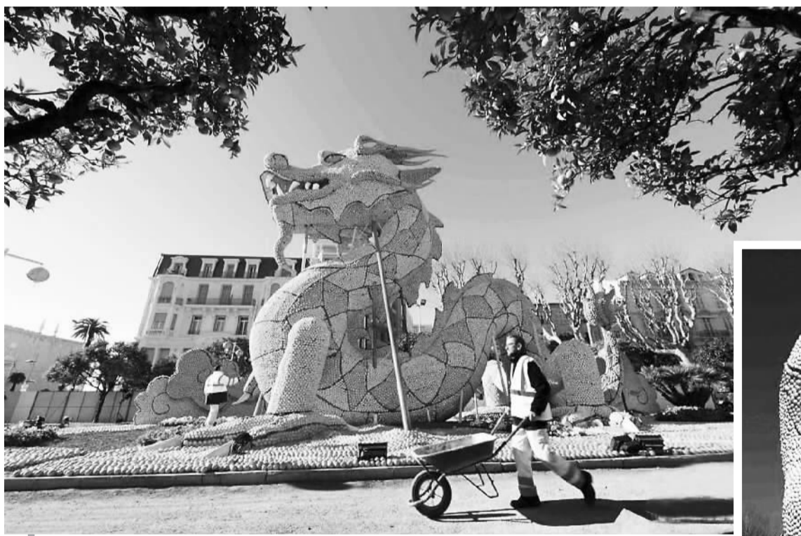
法国举办柠檬节 中国元素吸睛