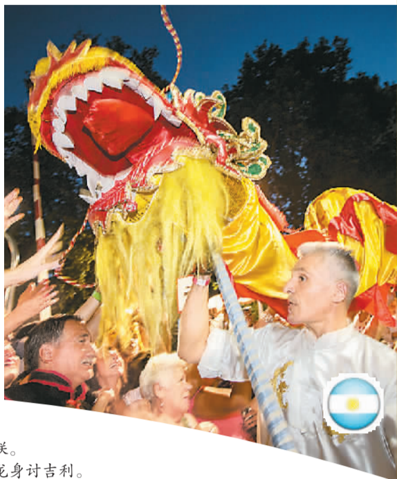
▲ 2月13日,联合国秘书长潘基文展示书写的“春”字。 ▲ 2月14日,在塞内加尔达喀尔大学,塞内加尔学生贴春联。 ▶ 2月14日,阿根廷首都布宜诺斯艾利斯,观众在舞龙表演上触摸龙身讨吉利。

本报北京2月15日电 综合本报和新华社消息:中国传统佳节春节就要到了,不少中国艺术家、音乐家走出国门,与国外同行、当地民众、华侨华人一起,用美妙的音乐、欢快的歌声和舞蹈歌颂友谊、迎接新春。