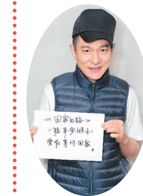
▲ 刘德华和他书写的祝福语

2月12日,在外来工比较集中的福建、陕西、四川、云南等省份的道路上,一支支主要由农民工组成的摩托车队伍,又踏上骑行返乡的旅程。不过,今年和往年略有不同,他们中有约500人身穿蓝色或红色的冲锋衣,后背上印有“回家的路”字样(见上图)。这些既能抵御风雪又很暖心时尚的冲锋衣,是由香港著名演员刘德华和《失孤》电影剧组赞助的。