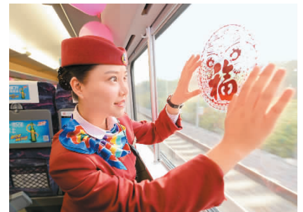
二月十一日，南昌铁路局首次开行厦门到南昌的D6301次动车，车旁精心布置“年味吉列”。图为列车乘务员在车厢内为农民工送上“年味吉列”。