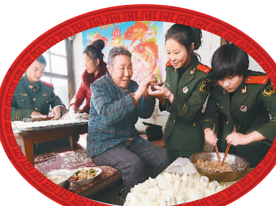
春节将至，辽宁省锦州市边防检查站爱民小分队官兵深入辖区孤寡老人、五保老人、失独老人家中，送去年货和问候。图为官兵和天桥村孤寡老人一起包饺子过小年。

祭灶王、吃饺子、请香放炮，这些活动不仅在北京流行，也是广大北方地区共有的“过小年”习俗。身处北方，人们在腊月二十三的小年里忘掉严寒，迎来春天。而到了南方，一般是腊月二十四过