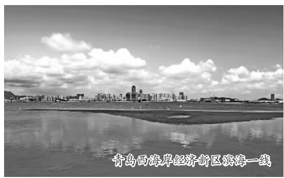
青岛西海岸经济新区滨海一线

模式，通过“政企合作”的模式(public-private partnership)开展基础设施建设、海洋经济、金融服务、节能环保、物流体系、智慧城市、科技商业和生活服务等领域的全域合作。