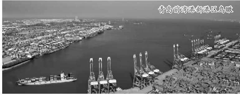
青岛前湾港新港区鸟瞰

海铁联运，在这里实现了无缝对接，同时也打造了“前港后站、一体运作”的海铁联运模式。