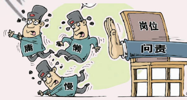
“让位” 徐 骏作