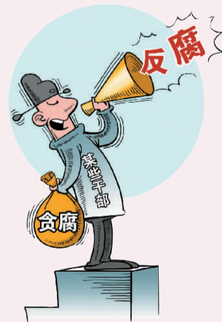
两面派 大 集作

但习近平早已说明，“鱼和熊掌不可兼得，当干部就不要想发财，想发财就不要当干部”。以为“法不责众”，认为“检查一阵子，享受一辈子”的随波逐流的心态，在重塑政治规矩、严明政治纪律的今天，是再也行不通了。