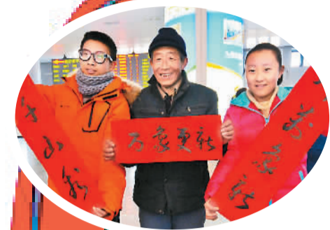
▲旅客在呼和浩特火车站获赠春联。本报记者 吴勇摄