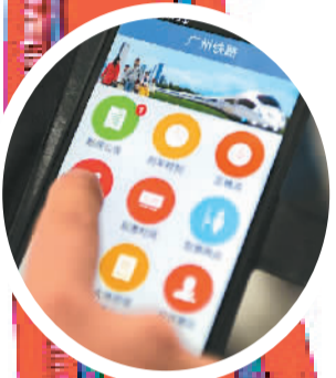
▼广铁集团发布便民软件“广州铁路”APP。