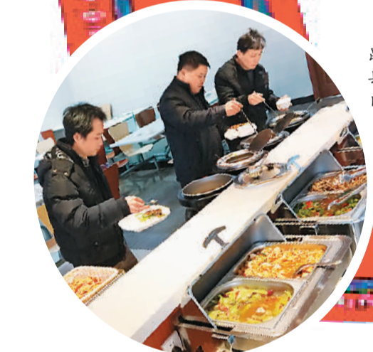
▲旅客在广昆高速广西容县服务区享用自助餐。