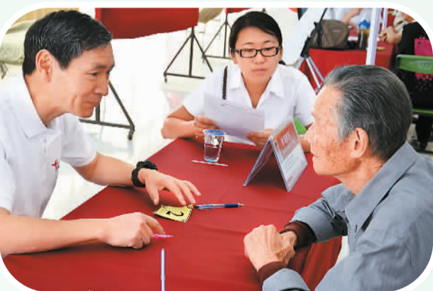
▲志愿者在泰北义诊。

多万人,这批高水平中医专家的到來让泰北华人感受到了血脉相连的温暖,同时这也是一项对外传播中国形象、传播中华文化的宝贵之举。