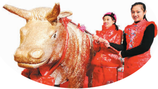
▲2月4日是农历立春,北京建国门街道在古观象台举办鞭打春牛仪式。