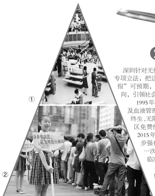
①读书在深圳已经蔚然成风 ②深圳小学生在劝导市民文明出行

2014年11月5日，深圳特区报与深圳新闻网主办的“点赞深圳十大文明行为”启动。活动一经发起便引来许多市民网友的关注，激发了许多人的热情和共鸣，市民网友们纷纷踊跃推荐自己心目中的深圳文明行为。经过专家评审和网络投票，20种文明行为入围“深圳十大文明行为”。