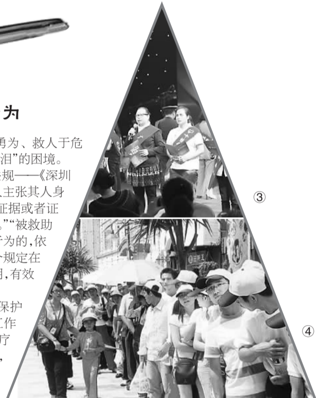
③深圳道德模范、身边好人共同宣读“日行一善”倡议书 ④深圳景区内游客排队游玩，秩序井然

这一系列的“好人法”，为好人好事撑起了一把保护伞，举起了一块坚实的盾牌，让正义得到伸张，让文明得以光大，让人们做文明达人没有顾虑，满心愉悦。