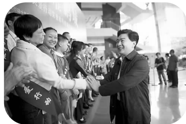
深圳市委书记王荣与道德模范握手

深圳罗湖区东门步行街作为全国著名的商业街，曾饱受乱扔垃圾、乱摆卖、占街乞讨等问题困扰。城管执法部门以《文明行为促进条例》等法律法规为依据，实施“垃圾不落地”等常态执法、综合执法，打赢了几场“官告民”的经典案例，对违法行为人产生了强大的震慑力。现在该街区面貌已经焕然一新，每天垃圾清扫量由原来的6吨下降至0.35吨，下降率达94%，乱摆卖现象下降95%。