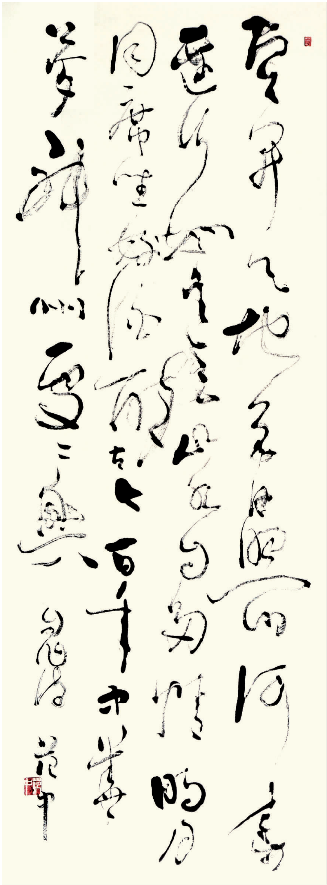
草书 书自作诗《中国梦》 云开天地色,日照山河春。 远行如有意,山水自多情。 明月同席坐,好酒醉古今。 百年中华梦,神州处处兴。