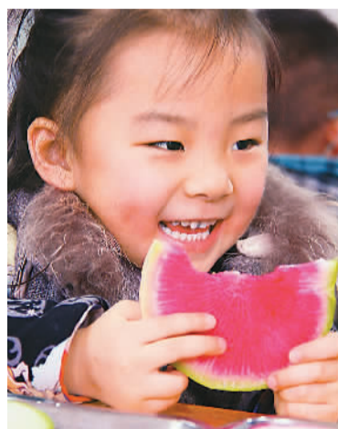
山东枣庄实验幼儿园的幼儿在吃生萝卜“咬春”。

唐初拿饼与生菜以盘装之，称春盘，也叫辛盘，宋时改叫春饼，现也叫薄饼、荷叶饼、片儿饽