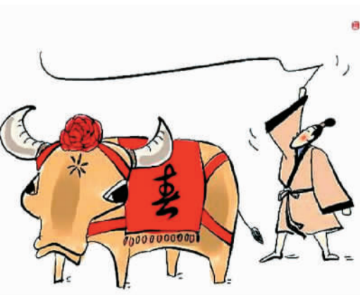
鞭打春牛

今天，绝大部分农村已经没有这项习俗了，农业生产早已科学化了，与打春习俗相关的舞春牛、闹春牛等民俗活动已经失去了巫术意义，成为一种艺术形式，供人欣赏。