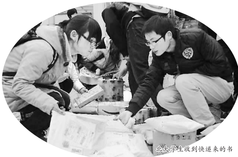
北大学生收到快递来的书

但电子书的阅读风潮却是难以忽视的。在电商巨头亚马逊上，同样一本新书，购买电子书和购买纸质书的