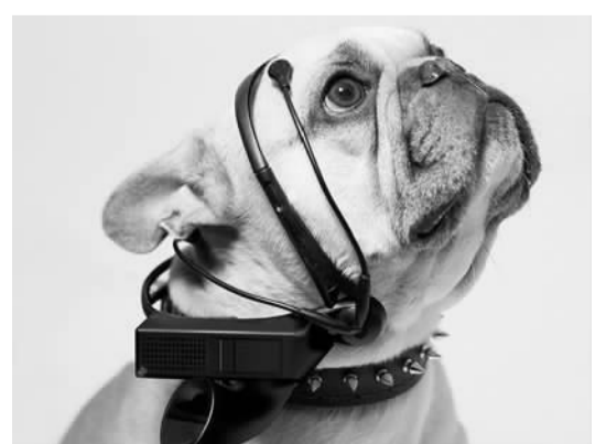
图为北欧发明与探索协会研发的专为宠物狗设计的头戴式耳机翻译器。