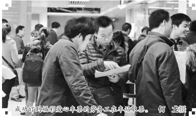
成功订到福彩爱心车票的劳务正在车站取票。

1月16日晚,深圳湾体育中心人头攒动,在古朴优雅的音乐故事《国学童谣》中,“2015关爱之夜”大型公益晚会开启了第十二届深圳关爱行动的前奏。晚会中,以英雄巡警陈文亮的感人事迹为原型的原创音乐情景剧《大爱的呼唤》演绎了“一对父母和一座城市,以爱心之城的名义呼唤一名英雄巡警醒来”的动人故事,深深打动了现场观众。