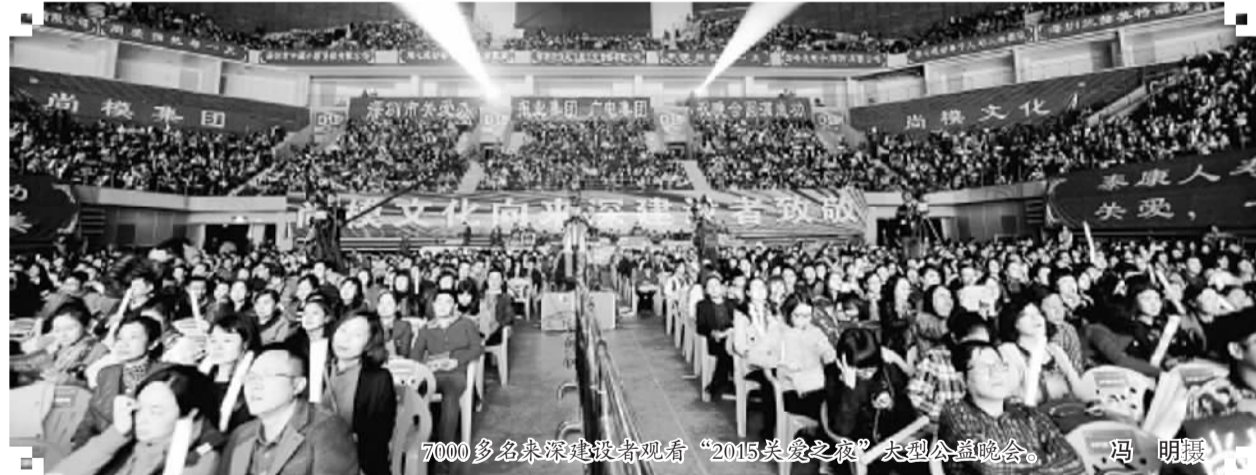
7000多名来深建设者观看“2015关爱之夜”大型公益晚会。

“用爱拥抱每一天,用心感动每个人”。关爱,涵养了深圳这座移民城市的胸怀、气度和现代文明。正如市委书记王荣所说,“越来越多的深圳人参与关爱行动,令人感动、骄傲和振奋。一批又一批的爱心市民,他们在帮助别人的过程中温暖着社会,提升了自己,获得了快乐和幸福,弘扬了城市的文明风尚。”