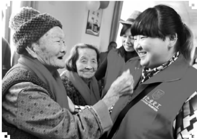
坪山义工们给敬老院老人们送温暖。