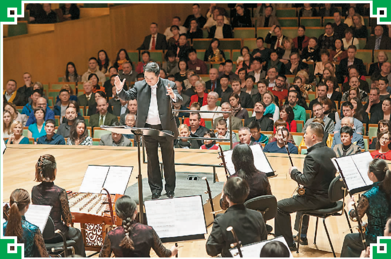
一月二十六日，上海民族乐团在匈牙利布达佩斯艺术宫巴托克·贝拉国家音乐厅举行中国春节民族音乐会。布达佩斯是上海民族乐团此次欧洲巡演的第一站。在未来两周，乐团将赴奥地利、瑞士、德国和荷兰等国继续巡演。