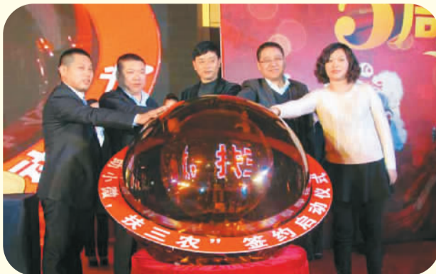
1月27日，助“小微”扶“三农”签约仪式暨普惠金融年会在京举办。会上，北京福州商会、北京江西商会与中润通签署了全面战略合作协议并启动了普惠金融计划。中润通财富管理（北京）有限公司推出的“润农贷”，贷钱给贫困农村的小微企业和农户，先后在北京郊区、郑州郊区支持了多家“三农”企业，受到社会各界好评。