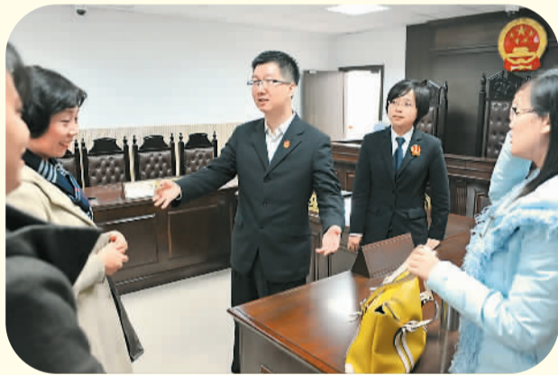
福建省厦门市思明区人民法院于1月24日成立全国首个“劳动法庭”。图为1月27日，法官在“劳动法庭”上为双方当事人进行劳动争议调解工作。