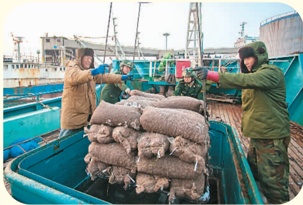
辽宁省大连市2014年水产品出口额首次突破20亿美元。图为大连湾边检站官兵为一般柬埔寨籍渔船办理完出境手续，该船将满载花蛤前往日本。