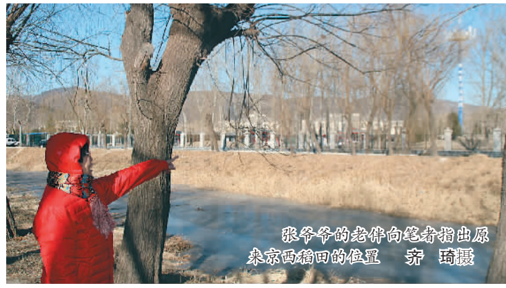
张爷爷老伴向记者指出原京西稻田的位置