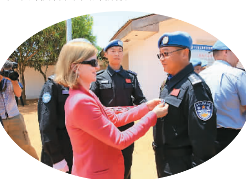
联合国秘书长特别代表兰德格林女士为第一支赴利比亚维和警察防暴队授予联合国和平勋章。

自2006年8月起，公安边防部队先后派出以福建、广东、云南、新疆等四省（区）边防总队官兵为主的6支维和警察防暴队赴海地、利比亚参加联合国维和行动。在烽火硝烟的维和战场，全体防暴队员牢记使命，克服万难，圆满完成了维和任务，被联合国秘书长潘基文誉为“维护世界和平的使者，中国的骄傲”。