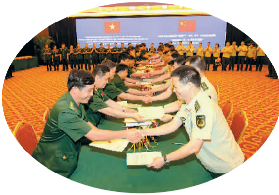
2014年5月19日，中越边防部队“共建友好站（队）屯，共创平安边境”试点工作暨全面推进启动仪式在南宁举行。

黑龙江虎林—马尔科沃口岸恢复开后，俄方取消了以往每周对开的客运和检验放行旅游团业务，在一定程度上影响了边贸经济的发展。为解决这个难题，2014年7月13日，黑龙江公安边防总队与俄罗斯太平洋地区边防管理局军事代表团在哈尔滨举行工作会谈，双方就尽快建立中国哈尔滨边防检查站与俄罗斯符拉迪沃斯托克空港边防检查站间工作联系、恢复开通虎林—马尔科沃口岸客运班机和旅游业务、实