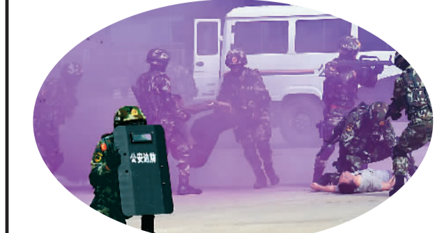
中俄边防部门举行“东方——2014”联合反恐处突演练。