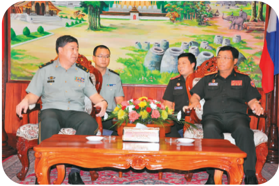
2014年10月12日至16日，公安部边防管理局政委李乐民（左）率团访问老挝，会见老挝国防部副部长苏温。