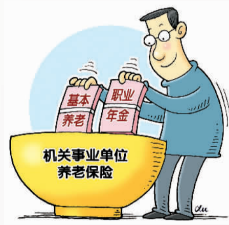
徐 骏作

费了那么大力气，铺垫了那么久，并轨这张牌终于打出来了。上承公务员改革的脉络和反腐的节奏，切中公众关注的热点，同时在具体的操作中完成顶层和底层设计，为改革中啃其他更难啃的骨头减少阻力。