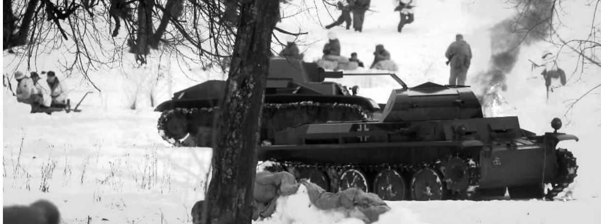
1月18日，军事爱好者在圣彼得堡红村重现列宁格勒(后改名为圣彼得堡)保卫战后期苏军突破德军封锁线的战役，纪念列宁格勒突围72周年。1941年，德国军队从四面切断了列宁格勒同外界的联系，全面围攻列宁格勒。1944年1月，苏军转入全面反攻，突破德军封锁，取得列宁格勒保卫战胜利。