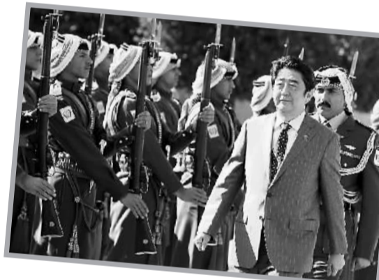
1月18日，在约旦首都安曼，日本首相安倍晋三（前右）检阅仪仗队。

近年来，3D打印机渐渐进入人们的视野。不管你是否承认，3D打印技术正分分秒秒地改变着我们的生活，打造着人们吃穿住行的新酷炫。