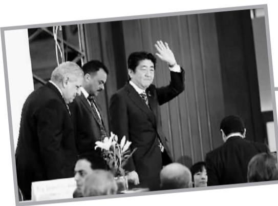
1月17日，在埃及开罗，日本首相安倍晋三在步入埃及—日本商业投资研讨会新闻发布会会场时挥手致意。

二战结束70周年了，今年，世界都在等待安倍内阁的反省。只是，重启“地球仪外交”的安倍内阁似乎还未流露出任何反省之意。