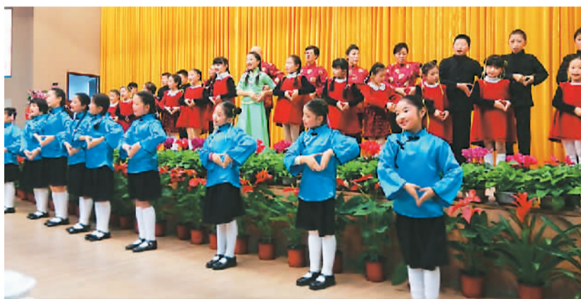
由中国社会福利基金会、中国少先队事业发展中心主办，辅导员公益基金、中少事业辅导员服务中心、河北威远邦集团承办的第四届“孝行天下——我爱妈妈 我帮妈妈洗衣服”公益活动1月18日在京启动。图为少先队员在启动仪式上演出。