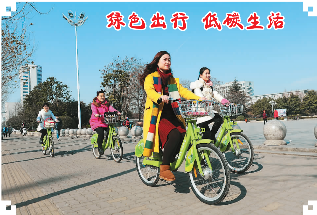
为缓解城市交通拥堵压力，安徽省阜阳市日前在城区设立151个公共自行车服务站点，陆续投放4000辆公共自行车，可免费租用1小时，倡导“绿色出行、低碳生活”。图为几名市民骑着公共自行车出行。

本报北京1月19日电（记者陆培法）教育部日前发布《深化考试招生制度改革实施意见》和《关于普通高中学业水平考试的实施意见》。