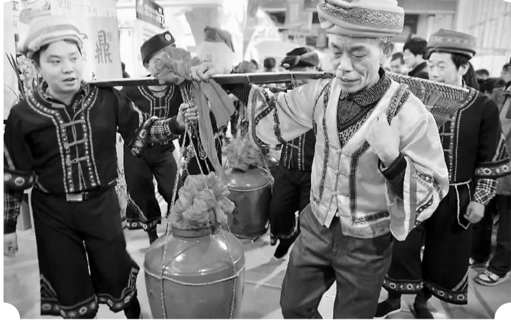
1月18日，第二届中国晒产品博览交易会暨中国恩施·世界晒产品博览交易会开幕，共有来自全国各富晒区近500家企业5000余件晒产品参展。本届晒博会共设全国富晒产品、晒资源开发利用、富晒特色产业、特色农产品四大展区，主题为“绿色富晒·合作发展”。活动由中国商业联合会、湖北省恩施土家族苗族自治州政府联合主办。