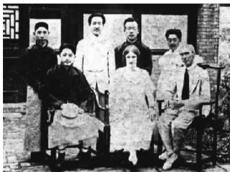
图为著名哲学家罗素（前排右一）1920年访华结束前与中国陪同人员合影。海归赵元任（后排左二）担任此次民间外交活动的翻译。

周恩来总理首创的民间外交，指的是以民间的名义进行的对外活动。在新中国外交史上，民间外交曾发挥了重要作用。“小球带动大球”的中美乒乓外交已经成为一段佳话。在积极探索中国特色大国外交的路上，中国更加需要发挥好民间外交的作用，“讲述好中国故事，传播好中国声音”。