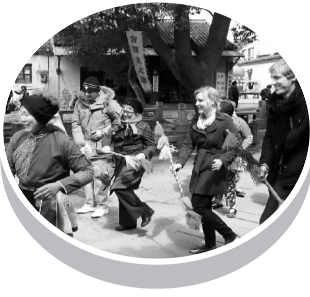
外国游客参与打连廊

古城苏州以桥多著名，在《平江图》碑上所标的桥，或说314座，或说359座，但以古城区面积15平方公里计，每平方公里也不到30座桥。而甬直，在不到一平方公里的面积上，曾有72座半古桥之说，目前仍有古桥37座。