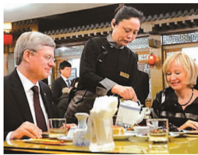
哈珀夫妇访华期间在老北京餐厅用餐