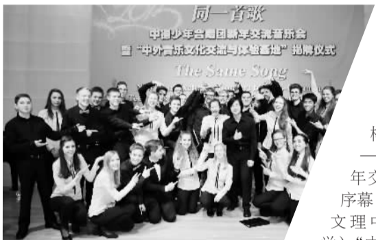
德国伯乐高级文理中学“中文合唱团”