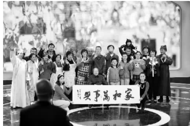
选手“摩登家庭秀”全家人在舞台

在肥皂剧满天飞、各类综艺占满黄金档的当下，《CCTV家庭幽默大赛》在使人捧腹之余，还传递出无限温暖情愫和正能量。（郑娜）