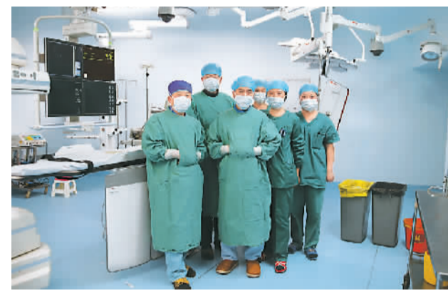
介入手术是一种先进的微创治疗术，由于手术操作需要长时间在x光射线下进行，医生必须穿着沉重的铅服进行手术，如同身着盔甲的生命卫士。图为1月6日，湖南省人民医院介入复合手术部团队手术后合影。