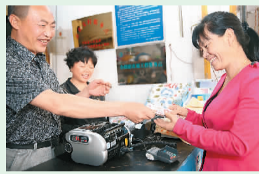
云南巧家县金塘镇农民正在用一卡通取款。