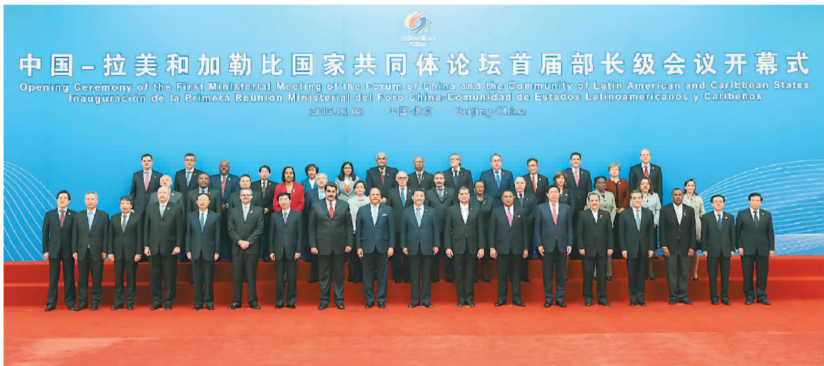
习近平出席开幕式并发表题为《共同谱写中拉全面合作伙伴关系新篇章》的重要讲话。