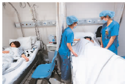
上海市瑞金医院的医护人员在病房内检查伤员。

根据上海市政府新闻办公室官方微博“上海发布”最新消息，继2日晨公布首批32名遇难者名单后，第二批3名遇难者名单也已初步核实，还有1名遇难者身份仍待核实。