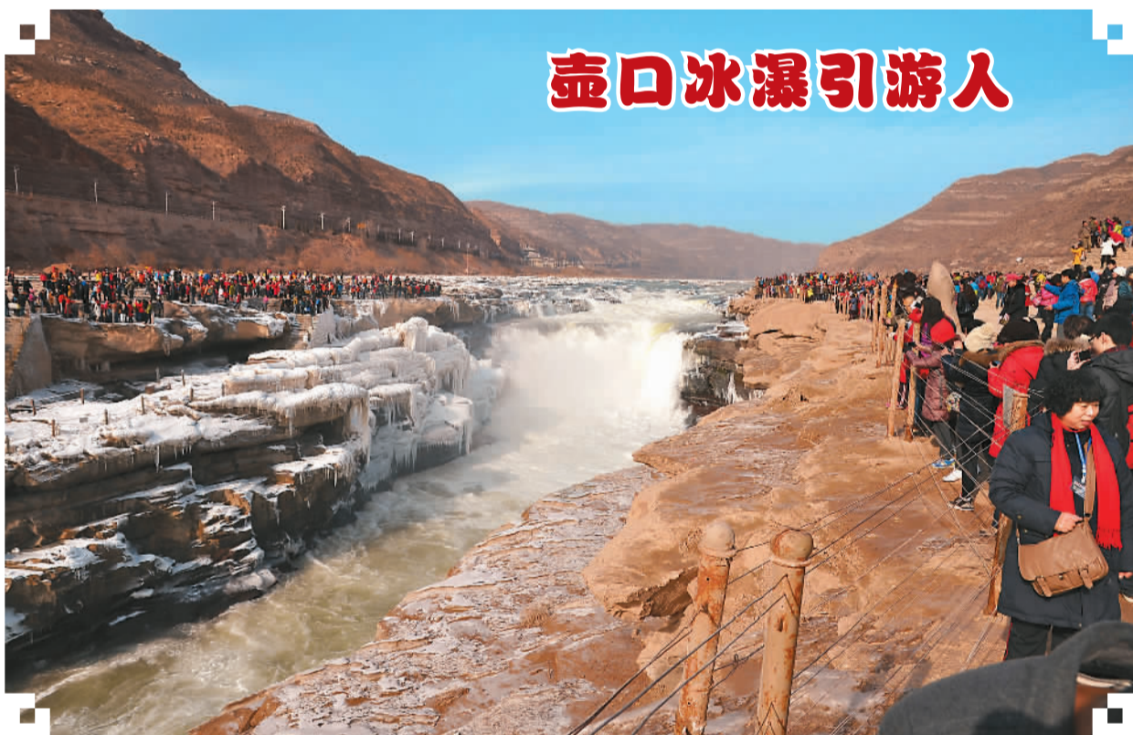
近日，山西吉县黄河壶口瀑布一片银装素裹，瀑布两岸大面积的冰瀑、冰雕奇观吸引了全国大批的游客和摄影爱好者前来观赏。图为1月2日，众多游客在壶口瀑布拍摄冰瀑奇观。

2012年，东北虎林园首次对东北虎开展规模化野化训练。截至目前，园区内已有六七百只东北虎参与了该项目，具备初级野外生存能力。