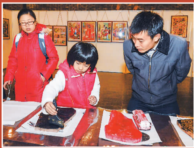
一月二日，一名儿童和家在北京中国国家博物馆内学习拓印木板年画。

在首都博物馆，馆内在基本陈列的基础上新推出“凤舞九天——楚文化特展”、“高棉的微笑——柬埔寨吴哥文物与艺术”等3个专题。前者体现了“传统文化”，让游客“饱览”厚重精致的礼乐之器与造型奇特而美丽的彩绘玉