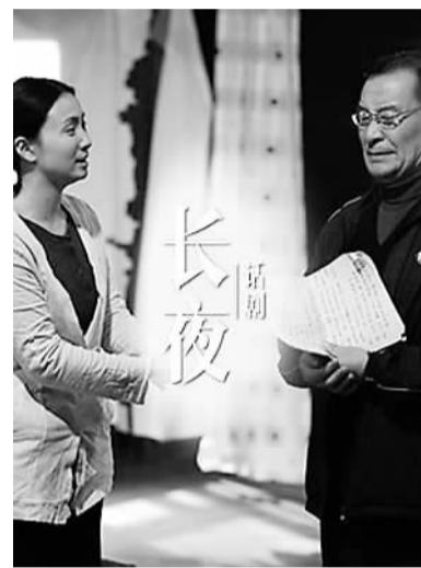
以文艺市场最为活跃的北京为例，2015年元旦、春节期间，北京将举行277台、1190场各类专业院团文艺演出。图为新年期间推出的话剧《长夜》。

除此之外，医护人员的“专家解说”，则为这档节目增添了几分科普色彩。当产科医生拿着产前协议，来给孕妇做详细讲解时，观众和节目中的产妇一起，上了一堂生动的“风险预估”课；当产科医生根据产妇的特殊情况，做出恰如其分的判断，给出适当建议时，这档节目的意义，无疑已经超出了普通综艺节目的界限，成为一档中国式生产的“必修课”。