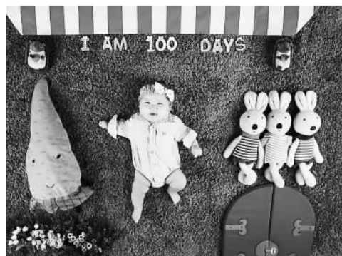
第九集的妈妈们陆希到影楼为宝宝拍的创意写真

如上周五播出的节目中，有一位20多岁的母亲，两年前已生过一个女儿，然而观念传统的公公则一直期望她可以生一个男孩儿传宗接代。经不住公公婆婆的压力，这位年轻妈妈又怀了第二胎宝宝。节目在后期剪辑上，对于孕妇的紧张着墨并不多，但却通过细节的表现，折射出万千中国家庭中不可回避的话题和产妇的压力，令人深思。