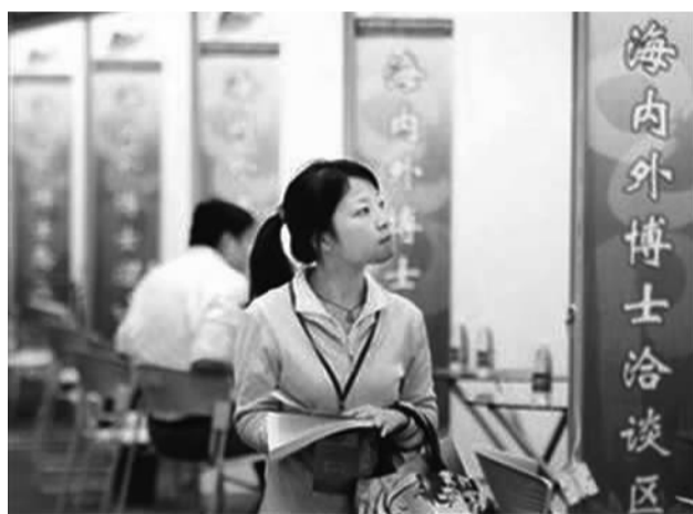
图为海归女博士就业洽谈现场。

对于新生代海归来说，越来越激烈的就业竞争已经成为“新常态”。受国际金融危机影响，发达国家就业