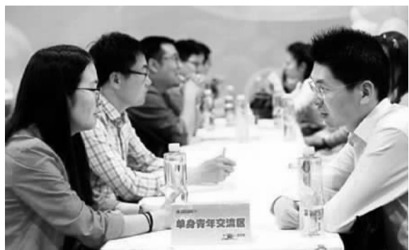
图为上海第五届婚恋博览会，海归专场成为亮点之一。