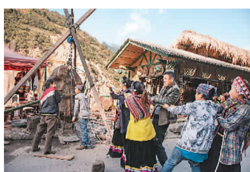
随便支起一块石头，就是一个景点。

离开张丽萍家，上一个土坡，下一个山坡，再下一个土坡，经过一棵大树，看到村里卫生室，再走几步，就到了紧邻教堂的七三客栈。七三客栈，二楼正中挂着“招财进宝”的匾额，一串串的玉米搭在楼道扶手上。近几年，从丙中洛镇到察瓦龙乡再到察隅县的简易公路“丙察察”路线，是滇藏川等地进藏的八条路中最难走的一条，成为游客越野的经典线路，秋那桶是滇藏交界的必经之地，加上村子多次被多个机构评为“最美乡村”，开客栈也就成为村里人的一个重要营生。除了七三，“阿土家”等客栈也很出名，卖怒江石也是村里人的一门生意。不止秋那桶，这些生意也成为丙中洛镇人的重要选择。游客的到来，改变了他们的生活、看世界的眼光，但不会动摇他们的坚守，对神山的爱护便是其中之一。丙中洛镇政府，位于丙中洛坝子，海拔1750米，是怒江峡谷深处极为少见的开阔平地，四面环山，坝子周围的石崖多为羊脂玉岩