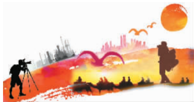
行进中国·精彩故事