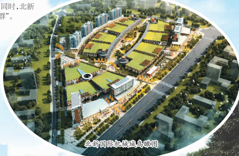
北新国际机械城鸟瞰图

北新国际机械城高举机械产业地产的旗帜,拟在全国打造300余个“北新国际机械城”,通过统一的物流信息、商贸信息与电商信息平台实现全国范围内的并网联营,为工业全产业链提供一体化解决方案,加速小微企业科技孵化,利于大中型企业经营布局延伸。未来,北新产业链服务体系将拓展至全球,实现协同发展。