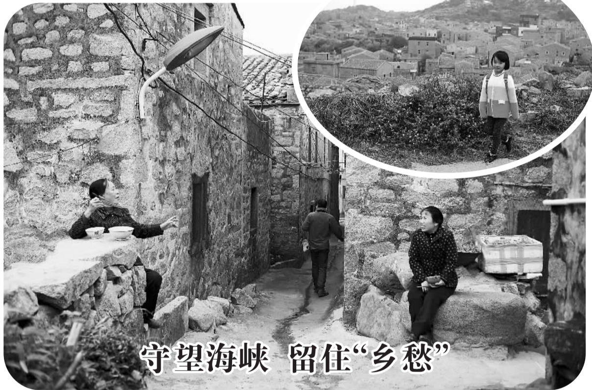
守望海峡 留住“乡愁”

福州市台办有关人士表示,榕台航线已成为沟通闽台两岸经贸文化交流和人员往来的黄金航线,尤其在每年春节、清明、中秋等传统节日,以及“海交会”“海峡论坛”“9·8投洽会”等重大经贸活动期间,航线的出入境人数都会成倍增长。