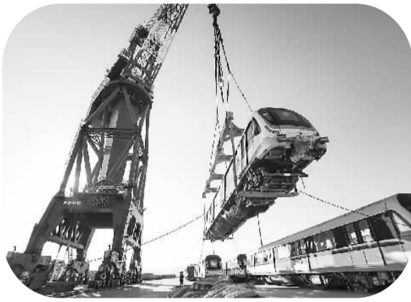
出口新加坡的地铁车厢12月25日在辽宁营口港装船外运。

机电产品、数控机床、港口设备、船舶制造等诸多行业，中国制造的产销量均跃居世界前列。