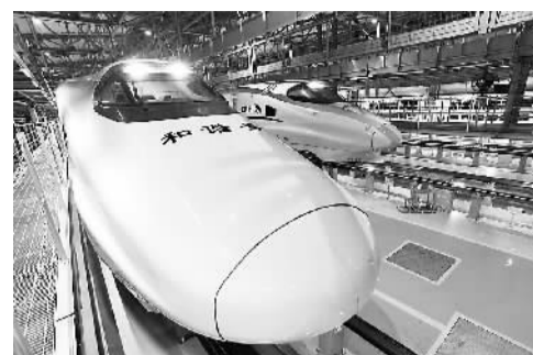
全长857公里的贵(阳)广(州)高铁今天开通运营,运行时间将由原来的20小时缩短至4小时。图为贵广高铁动车停靠在贵阳北火车站动车基地,蓄势待发。