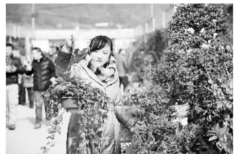
临近元旦,江苏镇江花卉市场鲜花开始畅销,经营户备足了货源,市民用鲜花装点居室,美化环境,辞旧迎新。