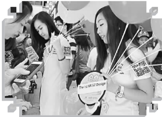
设计配对推广活动在火热进行

设计需要载体,无论是在香港还是深圳都不例外。深圳及珠三角拥有丰富的制造业,对设计的需求远远超过香港,这是香港设计转化为产品不可缺少的一步。不仅香港的设计需要制造业,近年来,内地对自主品牌的需求也非常旺盛。此次双年展,特地为两地企业开办“设计配对会”,希望借此推动设计与产业的结合。