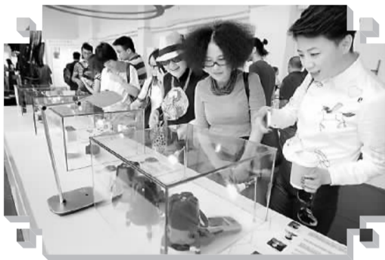
观众在参观设计展