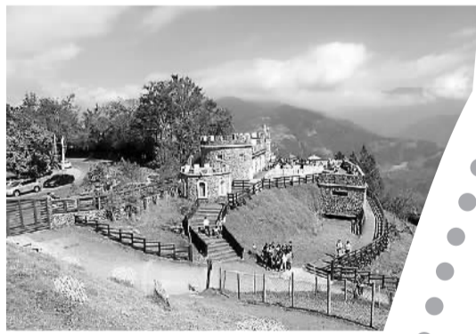
台湾的休闲农业发展较早,图为南投县的清境农场。

大陆高官访台带来什么?政党智库与学者往往将其视为大陆对台政策的重要指标。最初大陆高官