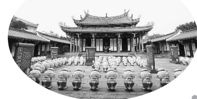
▶展览首站在台北孔庙,现场共展出143尊孔子Q版公仔。

12月23日,“启蒙 传承 文化再造之Hello Kongzi全球公益巡展——台湾站”台北孔庙开跑,展览将在台北、高雄等地展出至明年1月31日。此次展出的1600尊Q版孔子化身为好、拂须、作揖3种形象。展览期间,还将举办结合孔子六艺教学的体验活动与舞蹈表演活动,借此与参展民众互动,让民众在互动的过程中认识、重温孔子思想的博大精深。