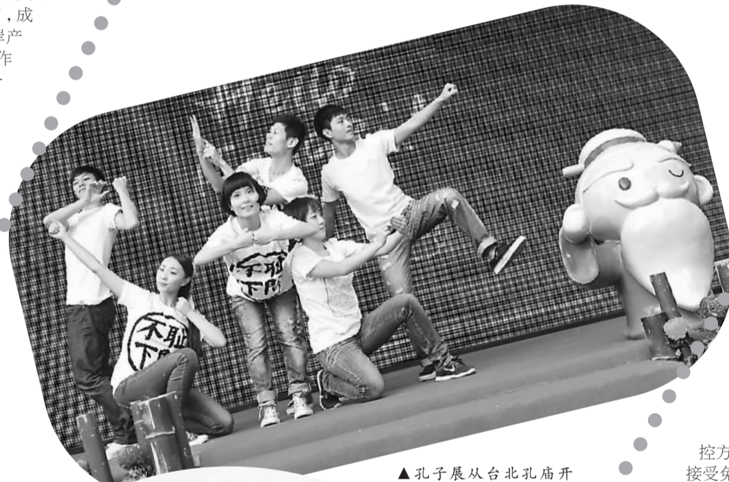
▲孔子展从台北孔庙开跑,以六艺精神创作的创意舞蹈与孔子公仔互相辉映。