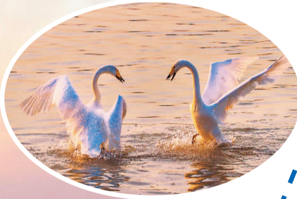
图为12月16日，河南三门峡天鹅湖国家城市湿地公园青龙湖畔，白天鹅正在水中嬉戏、觅食。

近年来，随着河南省三门峡市转型发展战略的实施，生态环境日益改善，越来越多的白天鹅把三门峡黄河湿地作为越冬的美好家园，三门峡市因此被中国野生动物保护协会命名为“中国大天鹅之乡”，有了“天鹅之城”的美称。