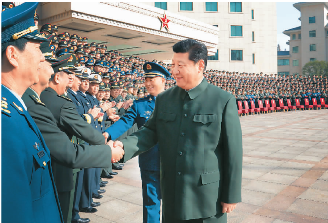
图为习近平接见驻宁部队师以上领导干部和南京军区机关团以上领导干部。

在听取南京军区工作汇报后,习近平发表重要讲话。他指出,要把思想政治工作抓得更加扎实有效。前不久召开的全军政治工作会议,重点研究解决从思想上政治上建设军队的重大问题,对加强和改进新形势下军队政治工作作出全面部署。学习贯彻全军政治工作会议精神,关键是要落到实处,在学习理解会议精神上下功夫,在改进创新政治工作上上下功夫,在纠正顽瘴积弊上下功夫,在解决突出问题上下功夫。要深刻吸取徐才厚案件的惨痛教训,从思想、政治、组织、作风上彻底肃清徐才厚案件的恶劣影响。要以徐才厚、谷俊山案件为反面教材开展警示教育,使各级干部特别是高级干部受警醒、明底线、知敬畏,切实引以为戒。要把铸牢军魂抓得紧而又紧,确保部队在任何时候任何情况下都坚决听从党中央、中央军委指挥。要打造强军文化,巩固部队思想文化阵地,坚定官兵革命意志、升华官兵思想境界、纯洁官兵道德