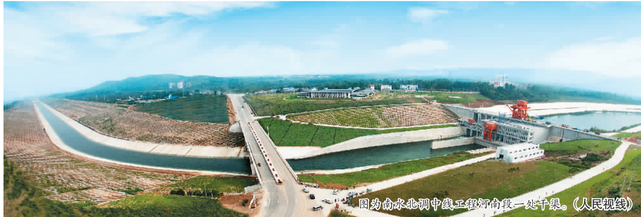
图为南水北调中线工程河南段一处干渠。

据新华社北京12月12日电 南水北调中线一期工程12日正式通水。中共中央总书记、国家主席、中央军委主席习近平作出重要指示，强调南水北调工程是实现我国水资源优化配置、促进经济社会可持续发展、保障和改善民生的重大战略性基础设施。经过几十万建设大军的艰苦奋斗，南水北调工程实现了中线一期工程正式通水，标志着东、中线一期工程全面建设目标全面实现。这是我国改革开放和社会主义现代化建设的一件大事，成果来之不易。习近平对工程建设取得的成就表示祝贺，向全体建设者和为工程建设作出贡献的广大干部群众表示慰问。