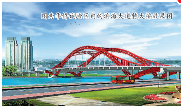
图为华侨试验区内的滨海大道特大桥效果图