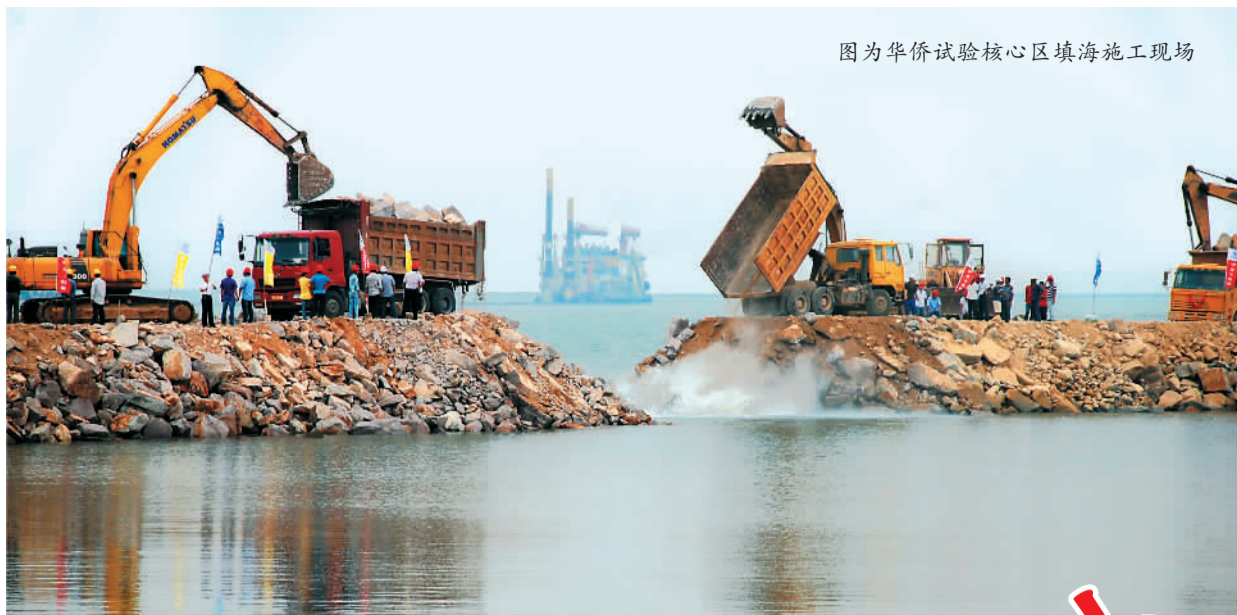
图为华侨试验核心区填海施工现场

一派热火朝天的新景象:东海岸新城片区已完成20平方公里的围海造地工程;珠港新城片区的总部经济园区已有73家总部企业获得认定;12平方公里的南滨新城片区作为成熟的、可供开发的建设用地,也在紧锣密鼓地开展建设中。