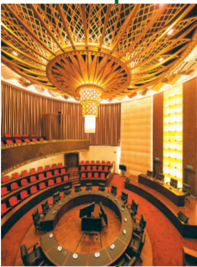
西栅枕水酒店会议厅一瞥