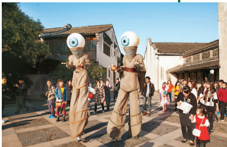
比利时剧团在戏剧节期间的表演

随着去年首届戏剧节的举办，乌镇成为了中国最密集的戏剧展场。除了前来休闲度假的游客外，乌镇也开始吸引全国各地的戏剧爱好者。1300多年的“东方威尼斯”，从上千场演出中焕发新的文化生机。这里既有阳春白雪的中西知名大戏，也有下里巴人的街头古镇嘉年华。立冬时来到小镇，游客可以饮一碗雄黄酒，在唯美设计的剧院看一场经典演出，评书场内聆听一场小镇对话的讲座，与青年艺术家们一起屏住呼吸，感受古老与儒雅、智慧与澎湃、疯狂与宁静。游客还可以加入到艺术的狂欢之中，跟着乐队一起放声歌唱，或是与即兴表演的艺术家共舞一曲，沉醉在艺术氛围之中。