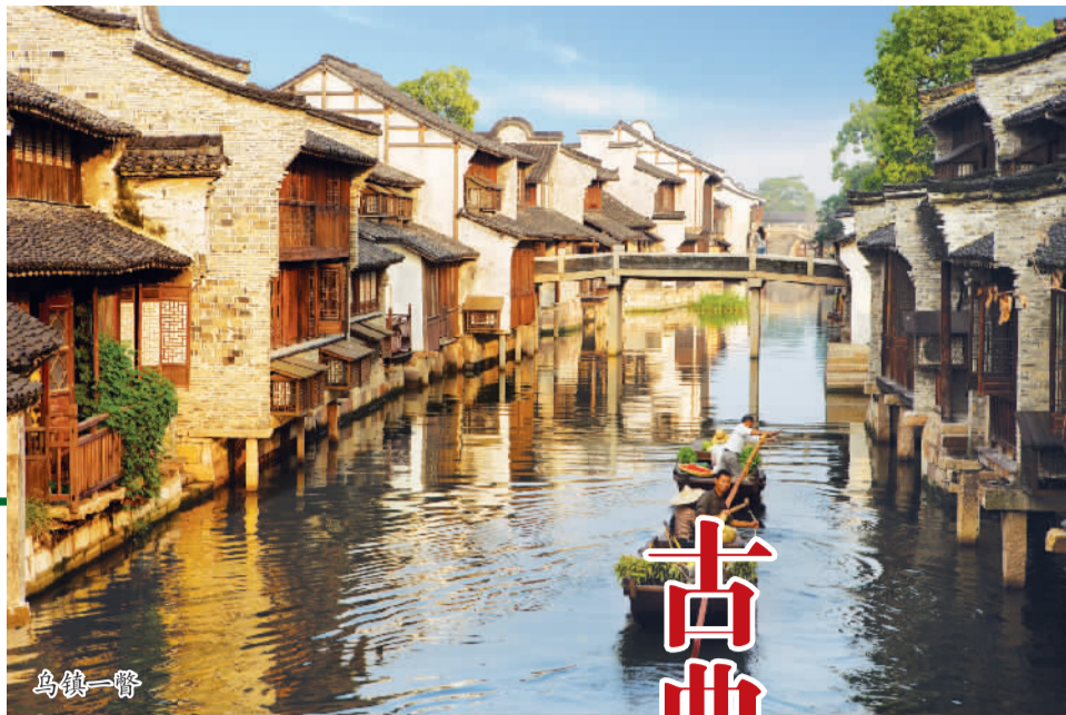
江南六大古镇走笔②