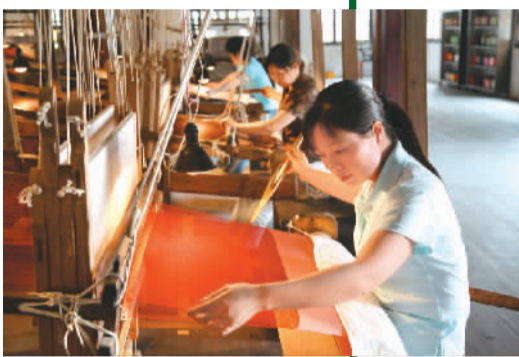
为游客展示乌镇民俗织锦