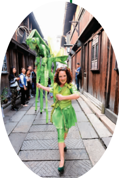
外国艺术家在乌镇表演

珠海去过多次，万山群岛却是头一回乘船弋至。从地图上看，那一个个小岛，很像是撒向大海的粒粒绿宝石，似乎还能听得见它们的玲珑之音。万山群岛又是依偎着珠江口上的伶仃洋，伶仃洋就是文天祥写下不朽诗篇《过伶仃洋》的地方。当年元军把这位民族英雄用船押解到此，逼他劝降南宋官兵，他却用“人生自古谁无死，留取丹心照汗青”之句，表达出誓死不从的精忠报国之心。如今，伶仃洋上再无伶仃之感，海岛旅游在这里已是风生水起，蜂拥而至的游客，在寻古探幽的同时，大多选择静静地呆下来，细细地品味着岛上玲珑玉翠般的绝美风光。