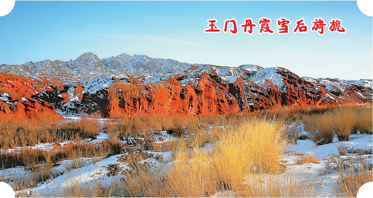
玉门丹霞雪后旖旎

看着亲戚们冒着严寒，忍着高原反应，受灾农牧民无不竖起大拇指感动地说：“我的亲戚亚姆热”。正如甘孜州委书记胡昌升所说：地震的无情，却让我们见证了更为融合的真感情。这份真情，来源于公职人员和农牧民群众面对面、手拉手、心贴心的倾情互助，来源于举全州之力推进群众工作全覆盖的倾力付出，在震后的康巴高原奏出了别样的“雪域情歌”。