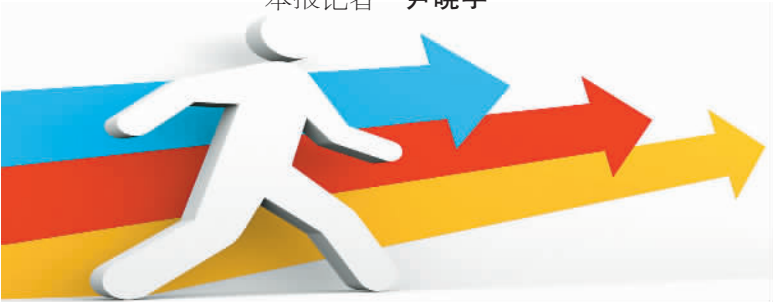
与“非领导职务”不是一个概念

“基层晋升空间太少，职务上不去，职级也就到头了。”中国人事科学研究院原院长吴江告诉记者，职级与职务并行实际是“分离”，打破“官本位”的理念，将原来职务与职级对应的单轨制，分离为职务与职级两条并行的晋升通道。职级与工资、交通等薪酬待遇直接挂钩，解决基层公务员的“天花板”问题。目前中国公务员队伍中，超过90%的公务员属于科员及科员以下职务，有60%是在县级以下政府机关。这无疑会调动基层公务员的积极性。