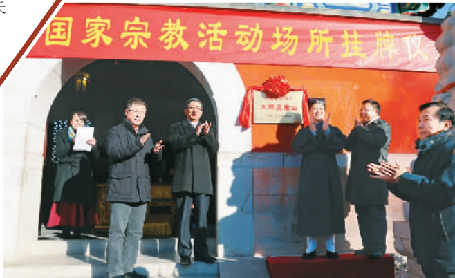
国家宗教活动场所挂牌仪式

中国佛教协会、中国道教协会直属寺观宗教活动场所标识牌挂牌仪式12月4日举行，北京广济寺、火德真君庙两座寺观分别挂牌。近年来，非宗教活动场所乱设功德箱、接受宗教性捐款、欺骗信众借教敛财等现象屡禁不止。依法登记的佛教道教活动场所悬挂统一标识牌，有助于推动佛教道教活动场所的规范管理。