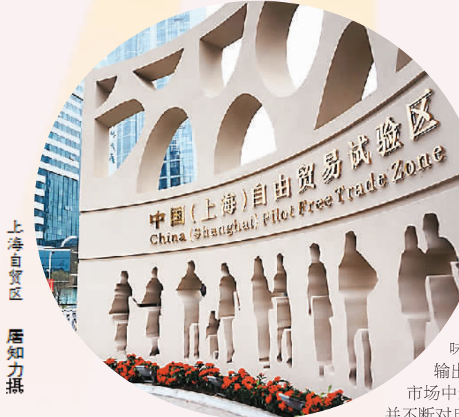
上海自贸区

跨境投资的投资者保护制度,加强监管协调等。沪港通的开启,搅动了改革的“一池春水”。