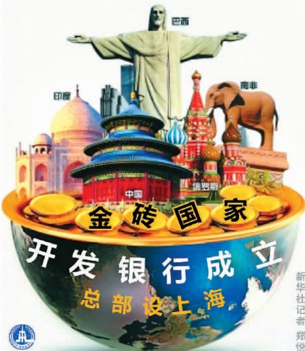
新华社记者郑悦编绘

“开放倒逼改革,开放越扩大,改革越深入。随着改革内生动力递减,就越发需要以扩大开放来为深化改革注入新动力。”沈晓明表示。