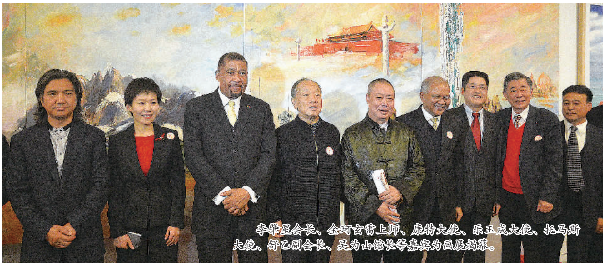
李肇星会长、金珂玄雷上师、康特大使、乐玉成大使、托马斯大使、舒乙副会长、吴为山馆长等嘉宾为画展揭幕。