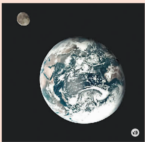
图①:地月合影图。 图②:探月工程三期再入返回飞行器飞行过程示意图。 图③:地月系统拉格朗日L1点示意图。