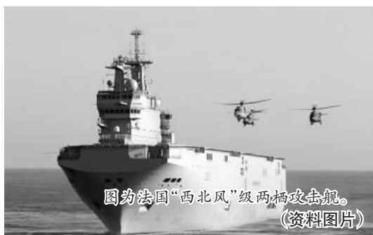
图为法国“西北风”级两栖攻击舰。(资料图片)

交易。法国本身跟俄罗斯关系十分密切,这笔交易又是很大的军工交易,对于法国非常重要。