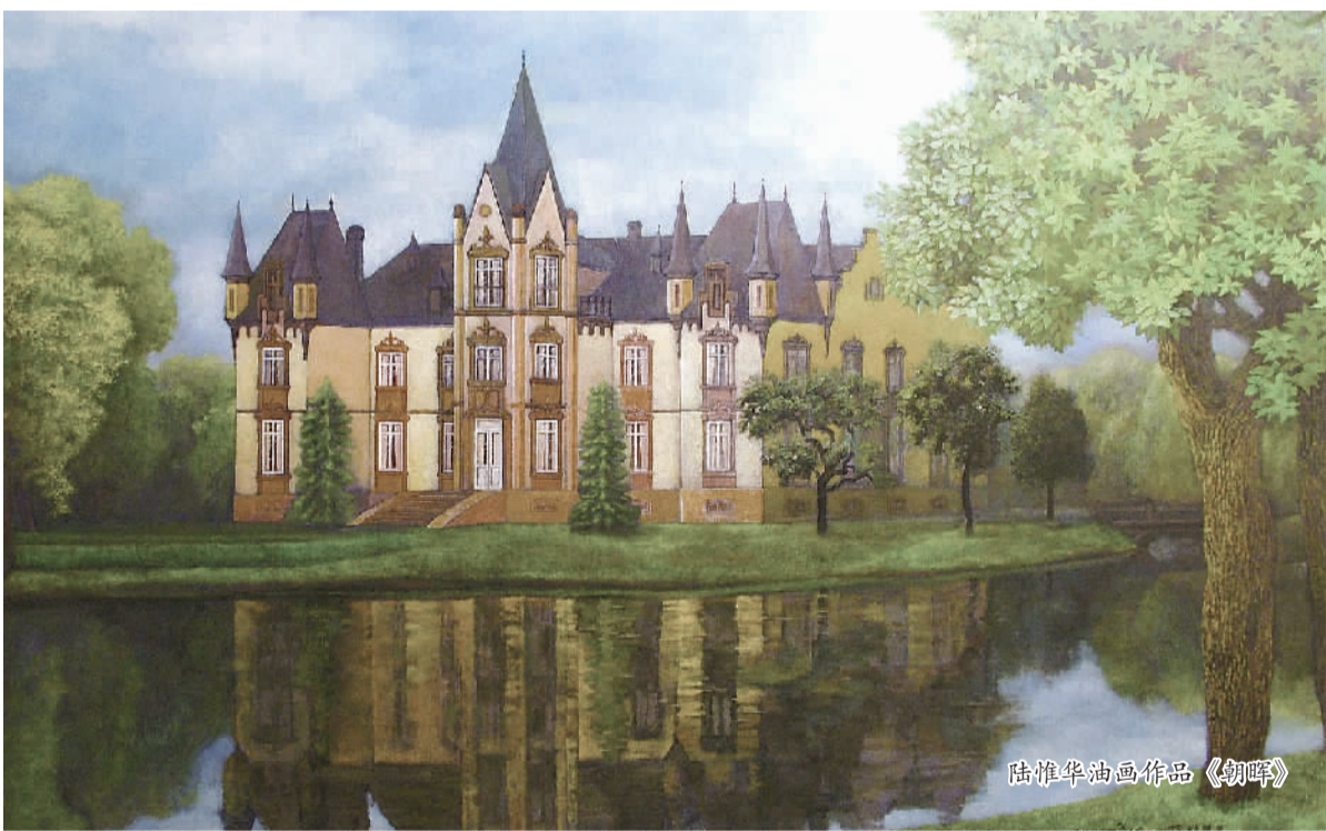
陆惟华油画作品《湖畔》

陆惟华先生画路很宽，写实、写意、抽象皆能，人物、山水、花鸟兼工，读他的许多介于意象、抽象、具象三者之间的画作，如花卉油画《春天的微笑》系列，就类似于欣赏音乐，这一系列的油画是艺术符号的抽思，并暗达含蓄深刻的艺术意境。在这个花卉油画系列中，他的主